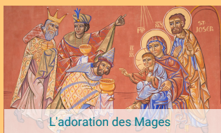
L'adoration des Mages