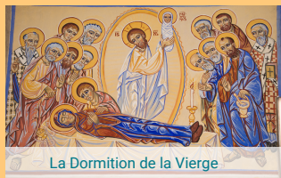
La Dormition de la Vierge