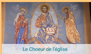
Le Chœur de l'église